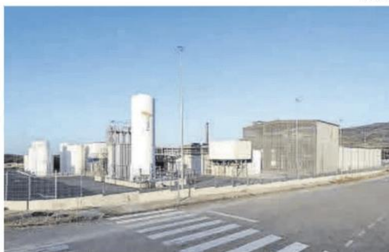
Imagen de la planta de Natac en Hervás.