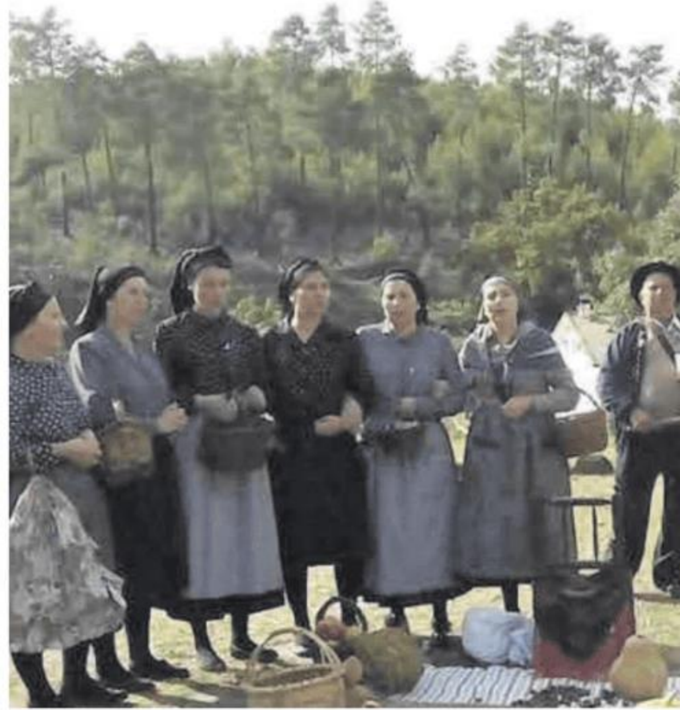
Las Comadres de Nuñomoral cantando en la era.

Después de este ritual comenzará otro, la Procesión del pan de las Ánimas, un desfile alrededor de la era donde el elemento principal y procesionado es una gran