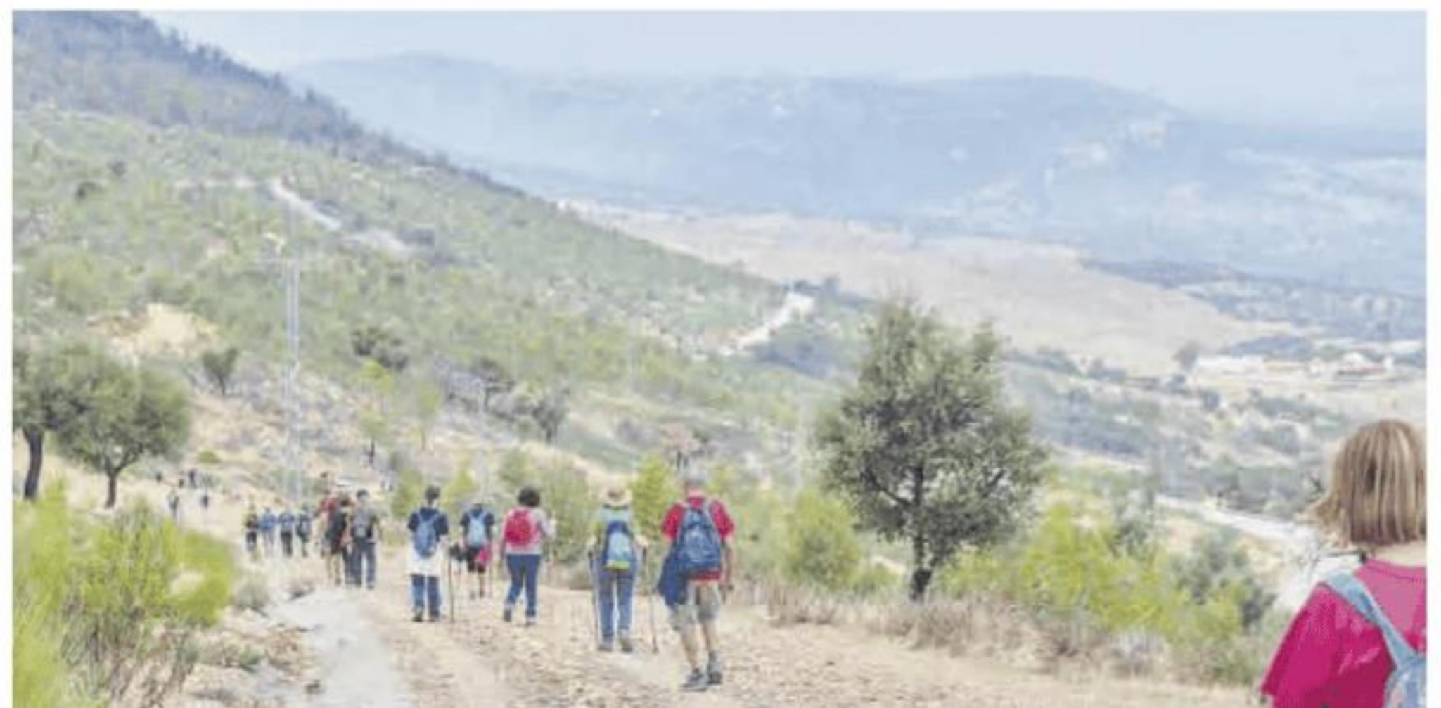
Imagen de la ruta 'Entreparques' a su llegada a Casas de Miravete.

Esta actividad aúna paisaje, actividad física, naturaleza, cultura y gastronomía, recorriendo uno de los parajes menos conocidos de los espacios naturales Unesco, el lugar donde de las sierras monfragüesas se encuentran con la