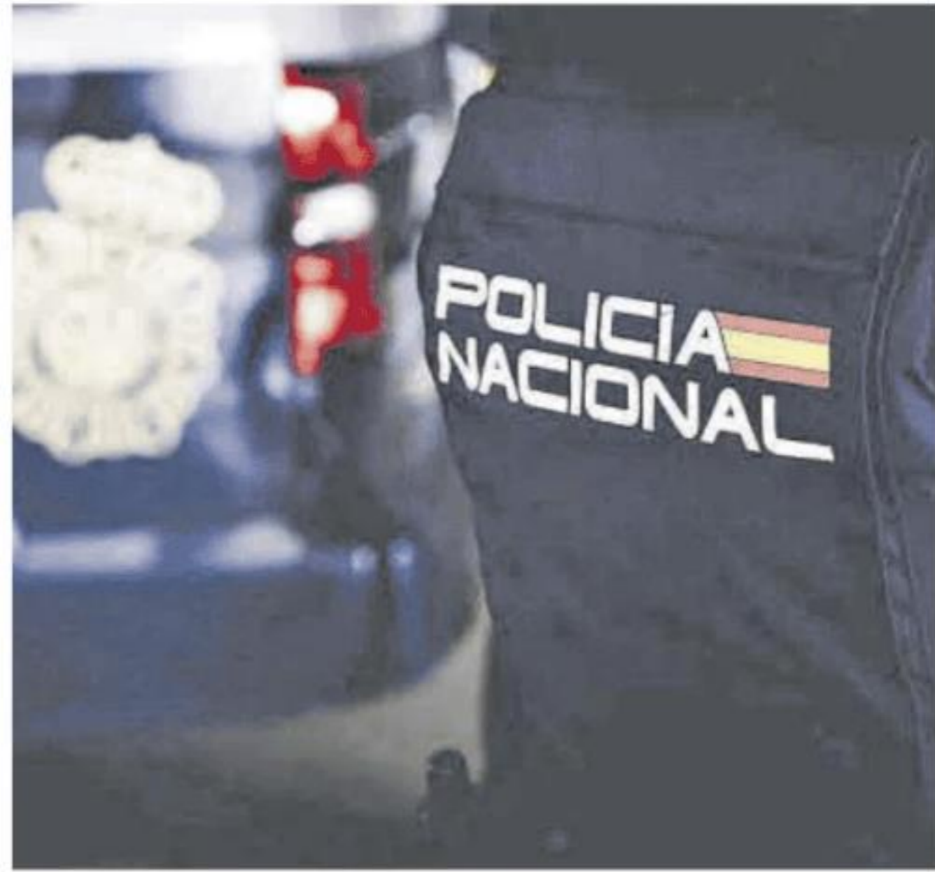
Los agentes de Policía Nacional detuvieron al varón en un domicilio.

sencia policial, concretamente de los agentes de Policía Nacional, adscritos al Grupo de Delitos contra el Patrimonio de la Comisaría Provincial de Badajoz, por lo que emprendió la huida hasta un domicilio familiar cercano ubicado en la calle Ramón de Larumbe, al cual accedió escalando una vivienda contigua, según ha informado este jueves el cuerpo policial. Fue precisamente en esa casa donde se produjo su detención. Algunas armas eran robadas Los efectivos detuvieron al hombre y comprobaron como en el domicilio familiar había numerosas armas de fuego y munición, motivo por lo cual se custodió la vivienda hasta su registro con autorización