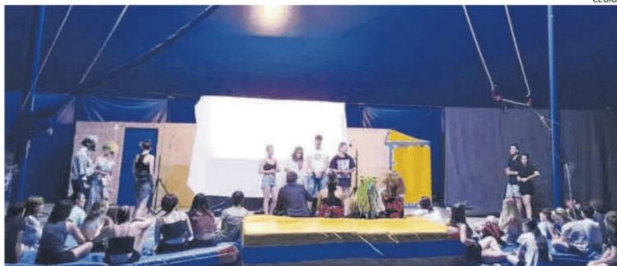
Actividad con jóvenes promovida por la escuela de animación.

El curso va dirigido a jóvenes de 16 años en adelante y la inscripción es gratuita. Las plazas son limita-