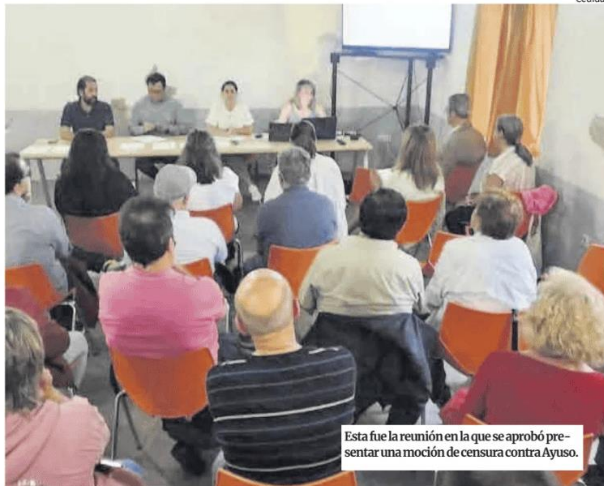
Esta fue la reunión en la que se aprobó presentar una moción de censura contra Ayuso.

Este sábado, celebrarán una asamblea para estudiar la posibilidad de crear una nueva directiva, aunque por el momento no existe constancia de ninguna persona interesada en querer recuperar el movimiento vecinal en la pedanía, que ha quedado «muy destruida», según cuentan algunos vecinos. ■