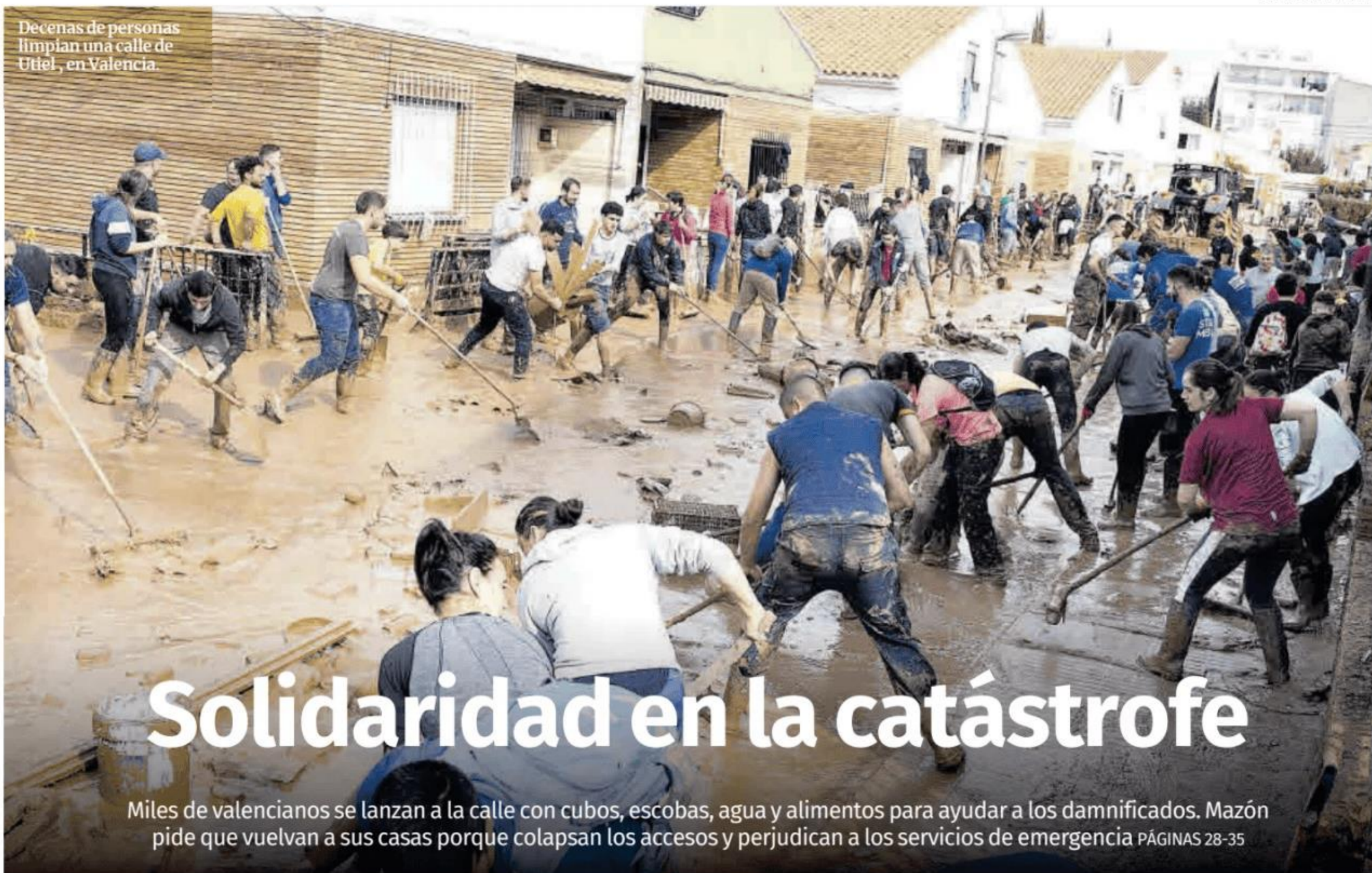
Decenas de personas limpian una calle de Utiel, en Valencia.