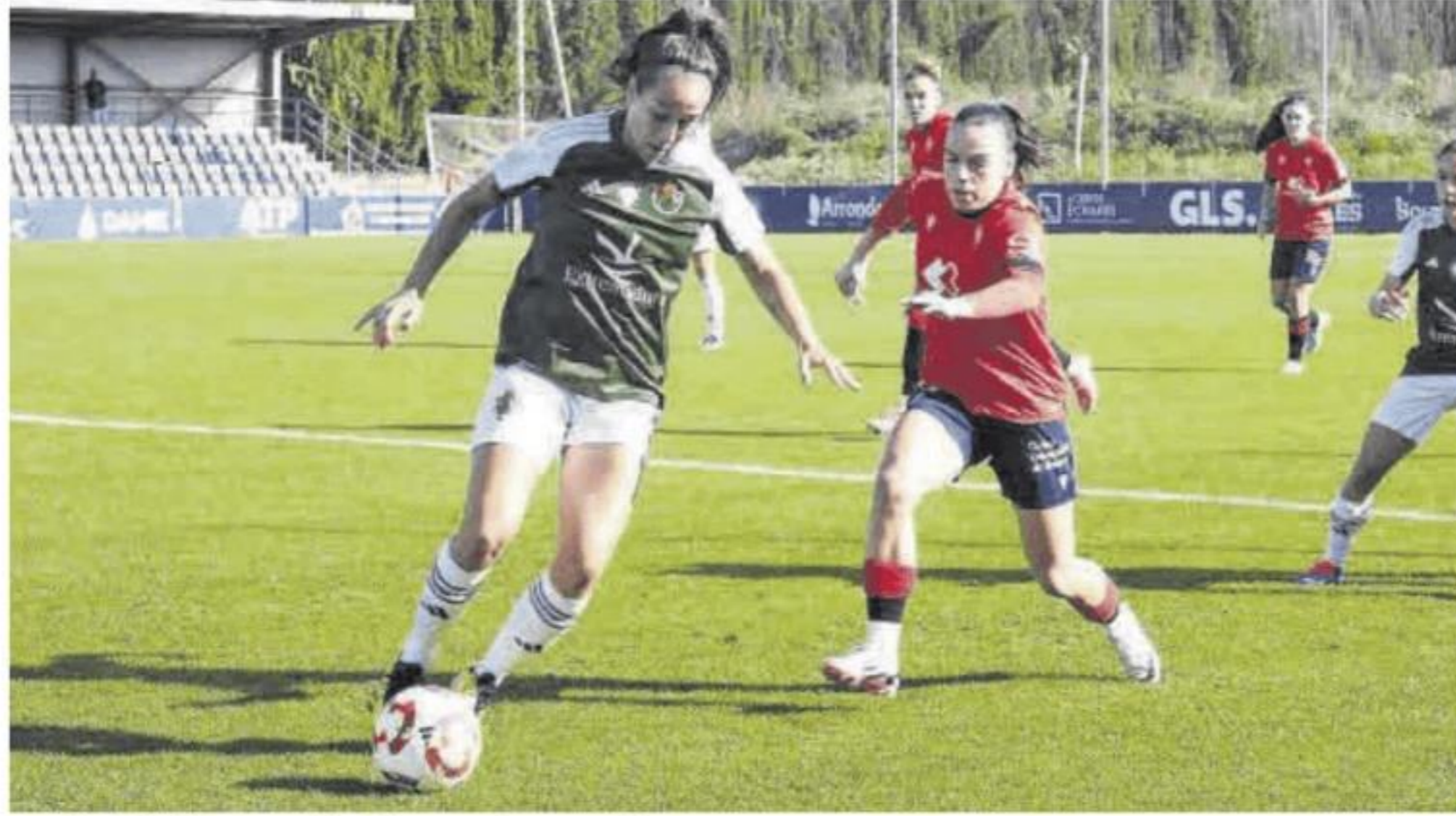
Acción del último partido del Cacereño Femenino, ante Osasuna.