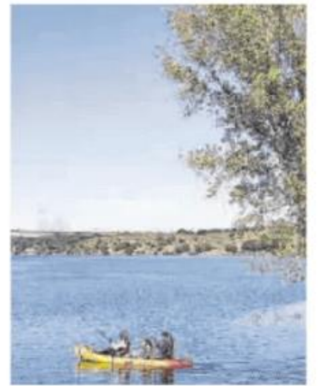
Mes de la Biosfera.