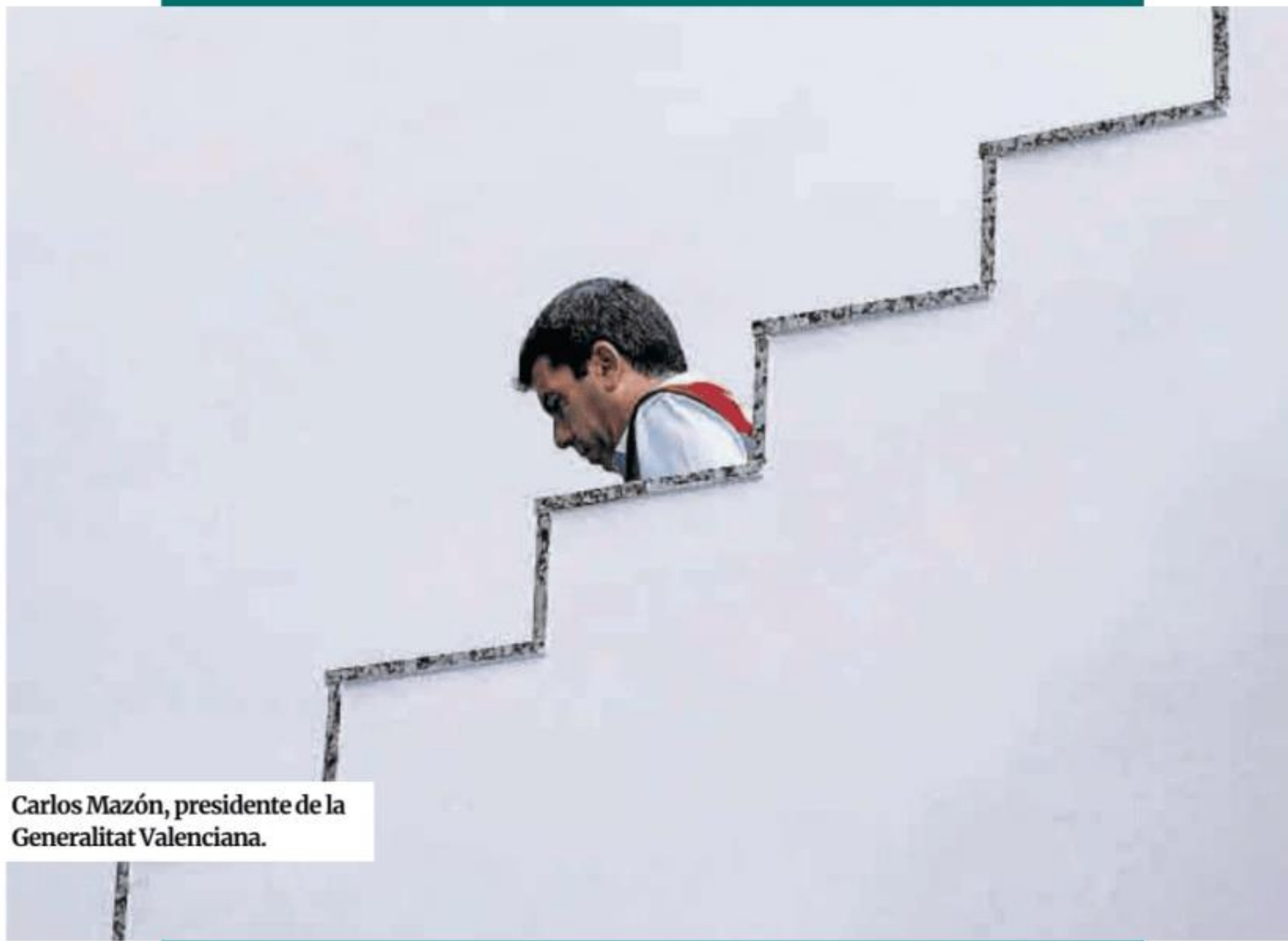
Carlos Mazón, presidente de la Generalitat Valenciana.