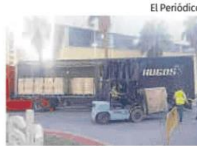
Solidaridad desde Mérida.