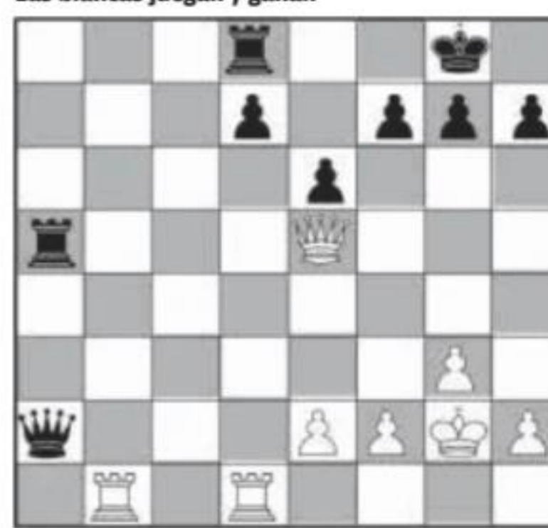
Solución ajedrez: 1-T8, Tab: 2-Tal