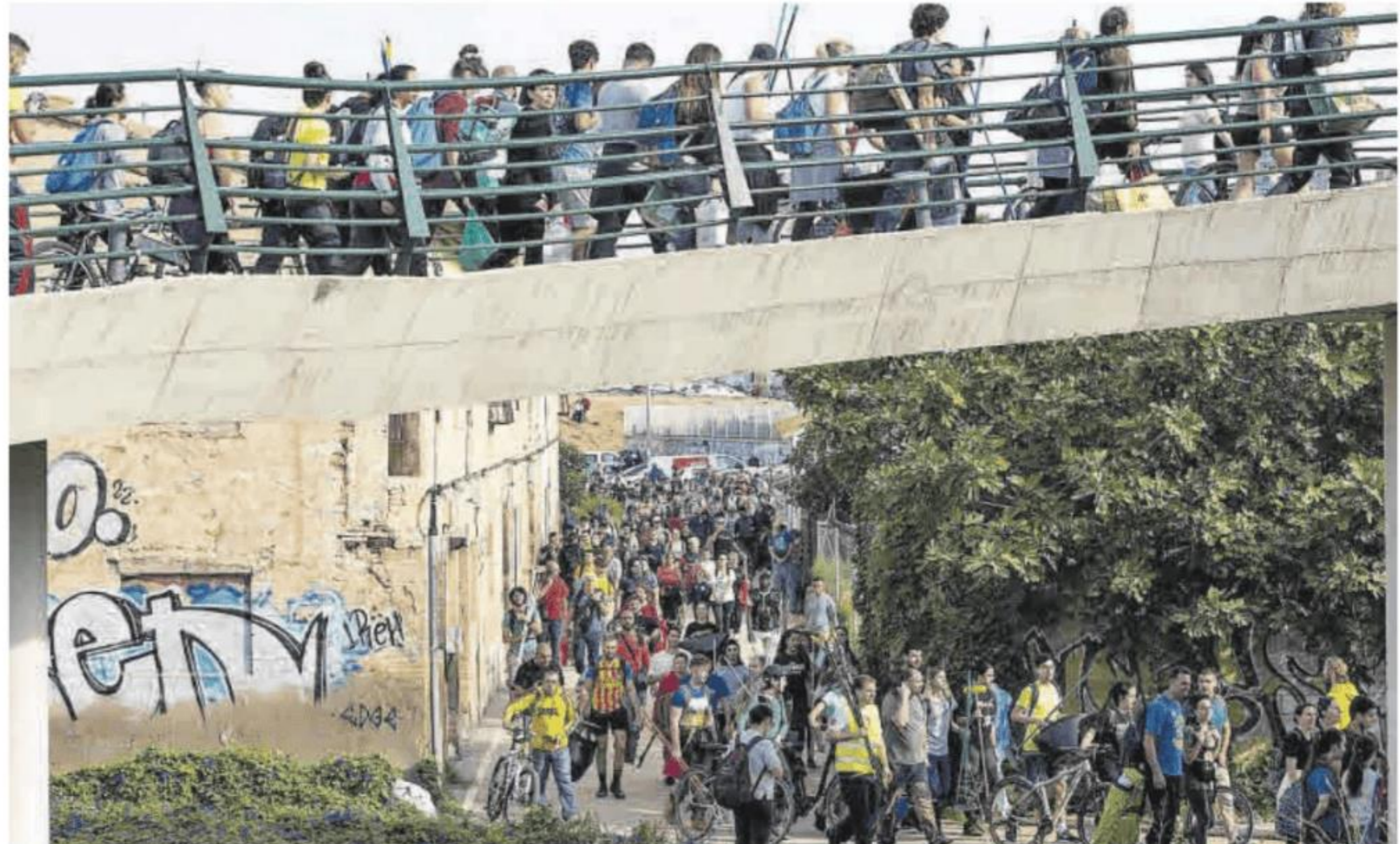
Cola de personas cruzando la pasarela de la pedanía de La Torre, un barrio de València al sur del nuevo cauce del Turia.

tos, aunque se centralizó en puntos concretos de la ciudad como los campos de Mestalla o Ciutat de València, cientos de personas decidieron organizarse por su cuenta para llevar garrafas de aguas y todo tipo de alimentos en bici, moto e incluso a pie. En València, son centenares los casales falleros que abrieron sus puertas para recoger víveres.