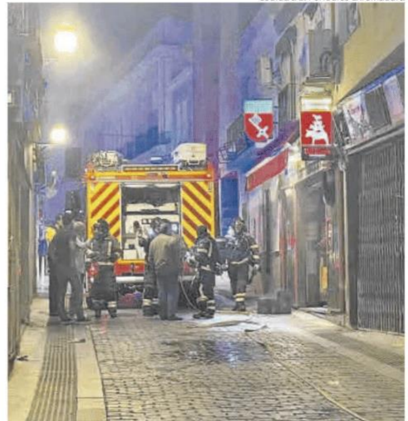
Los bomberos, actuando en la emblemática cervecería emeritense.