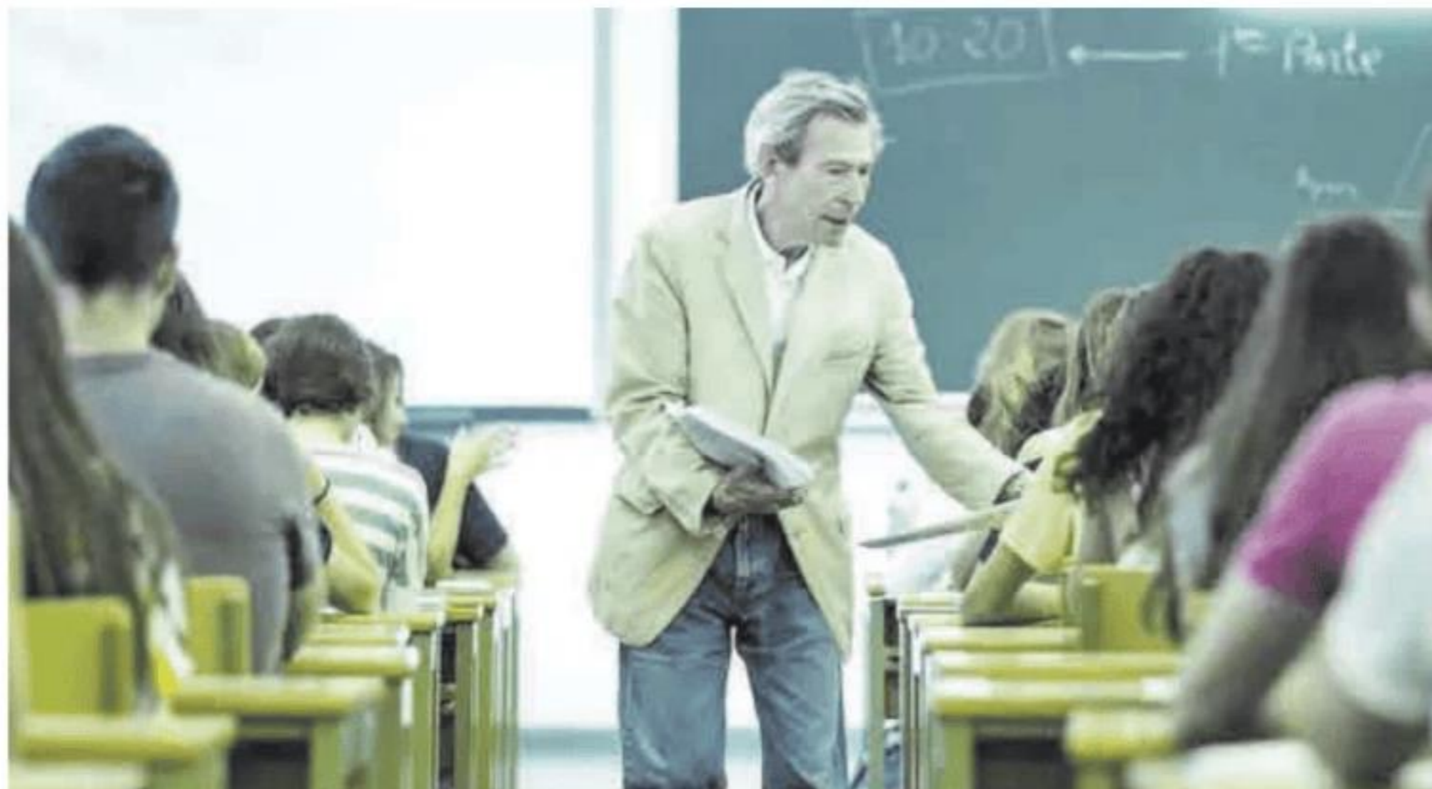
Un docente reparte un examen en una clase.

El proceso se realiza mediante concurso de méritos y ha despertado un gran interés entre los docentes (de las 1.101 solicitudes se han admitido definitivamente 1.051), precisamente porque se trata de un proceso que no se convocaba desde hacía 26 años, antes de la transferencias en Educación. Fue en 1997 cuando se realizó por última vez y de ahí que Extrema-