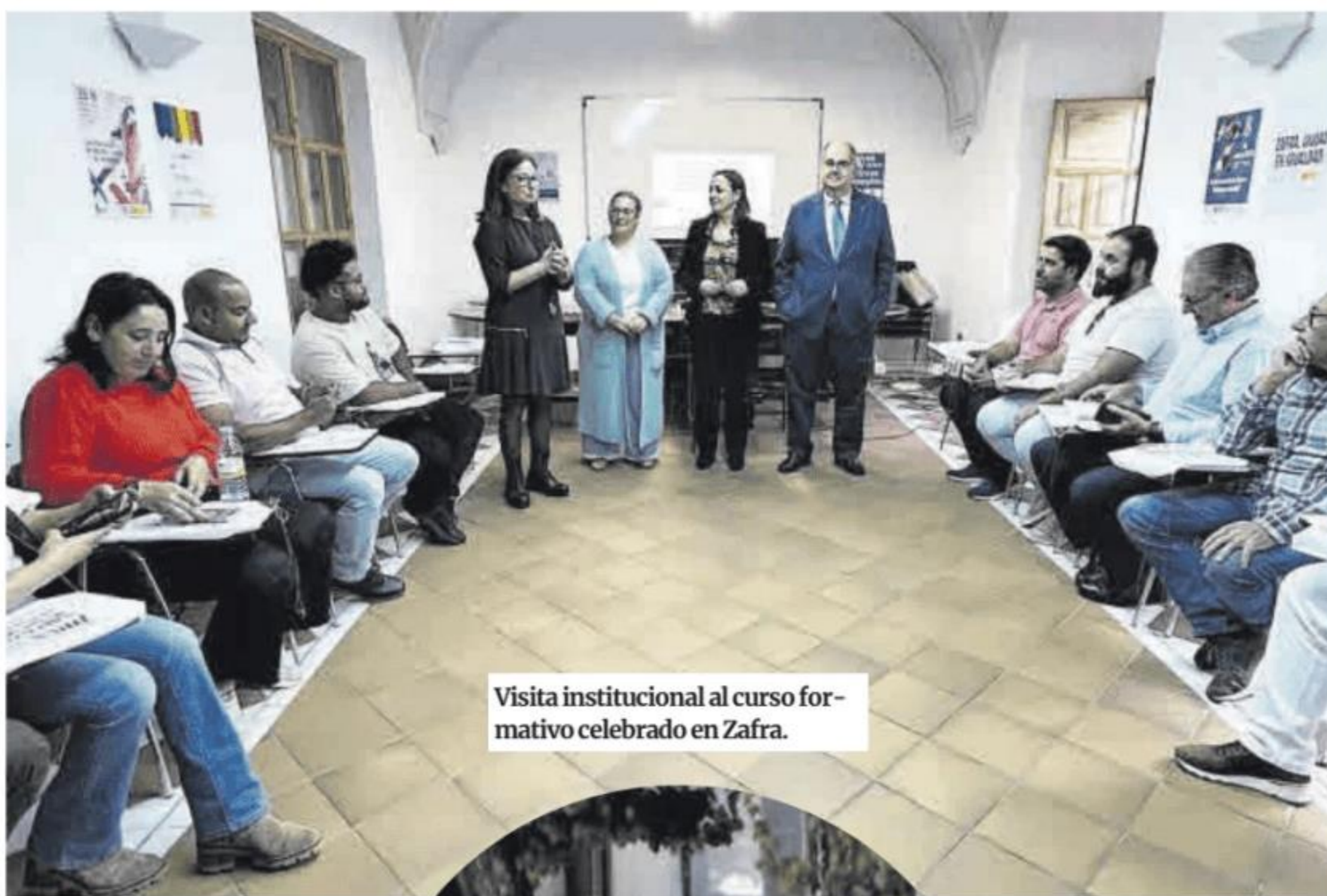
Visita institucional al curso formativo celebrado en Zafra.