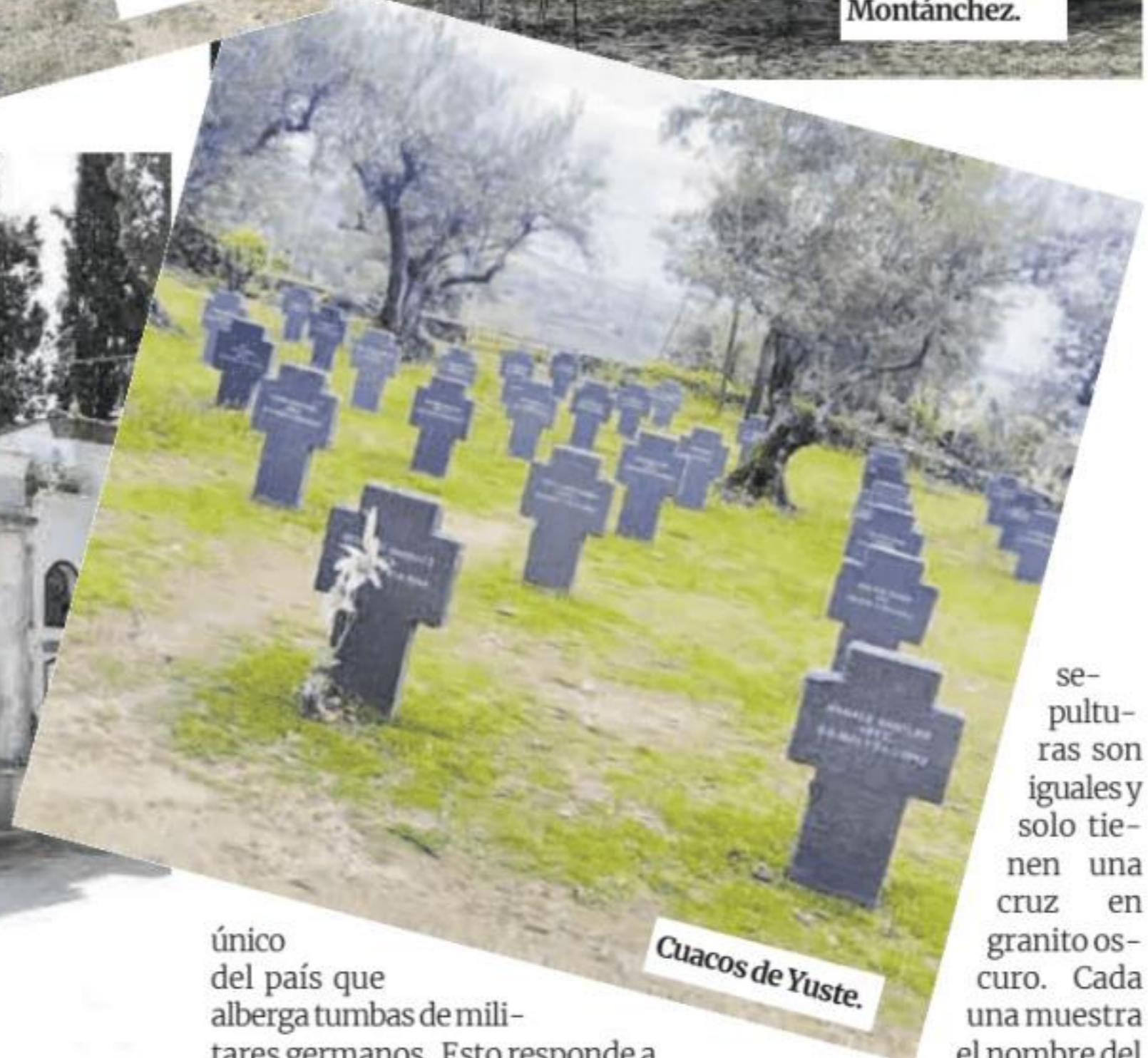
Cuacos de Yuste.

se encuentran las capillas del Carmen y San Pedro, ambas con muros de mampostería, y una inscripción para recibir al visitante: «Templo de la verdad que admiras. No desoigas la voz que te advierte. Que todo es ilusión menos la muerte». La parte más antigua está situada junto a la muralla del castillo de Montánchez y la mayoría de los nichos son de granito, hechos sobre la propia piedra de la