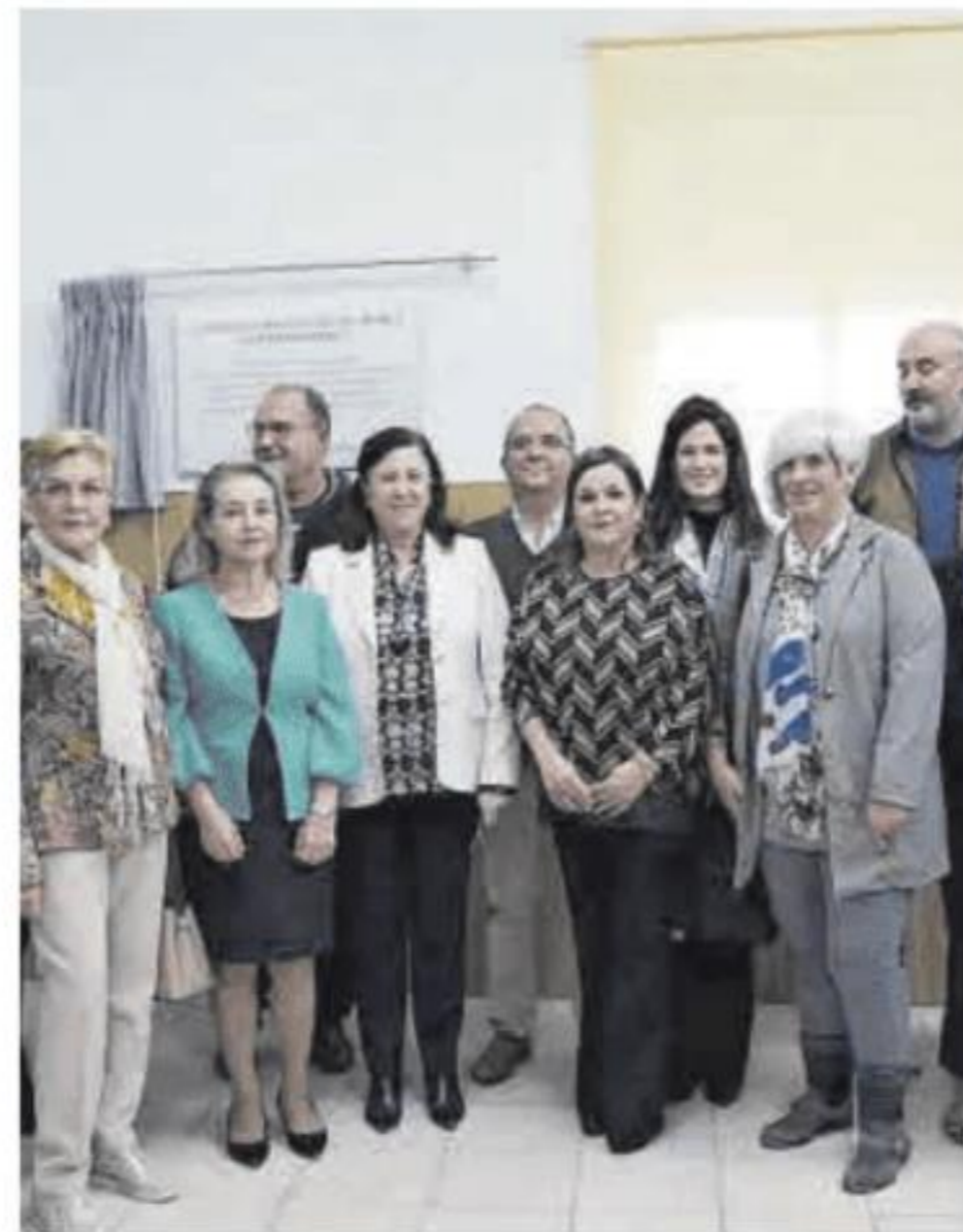
Algunas autoridades presentes.