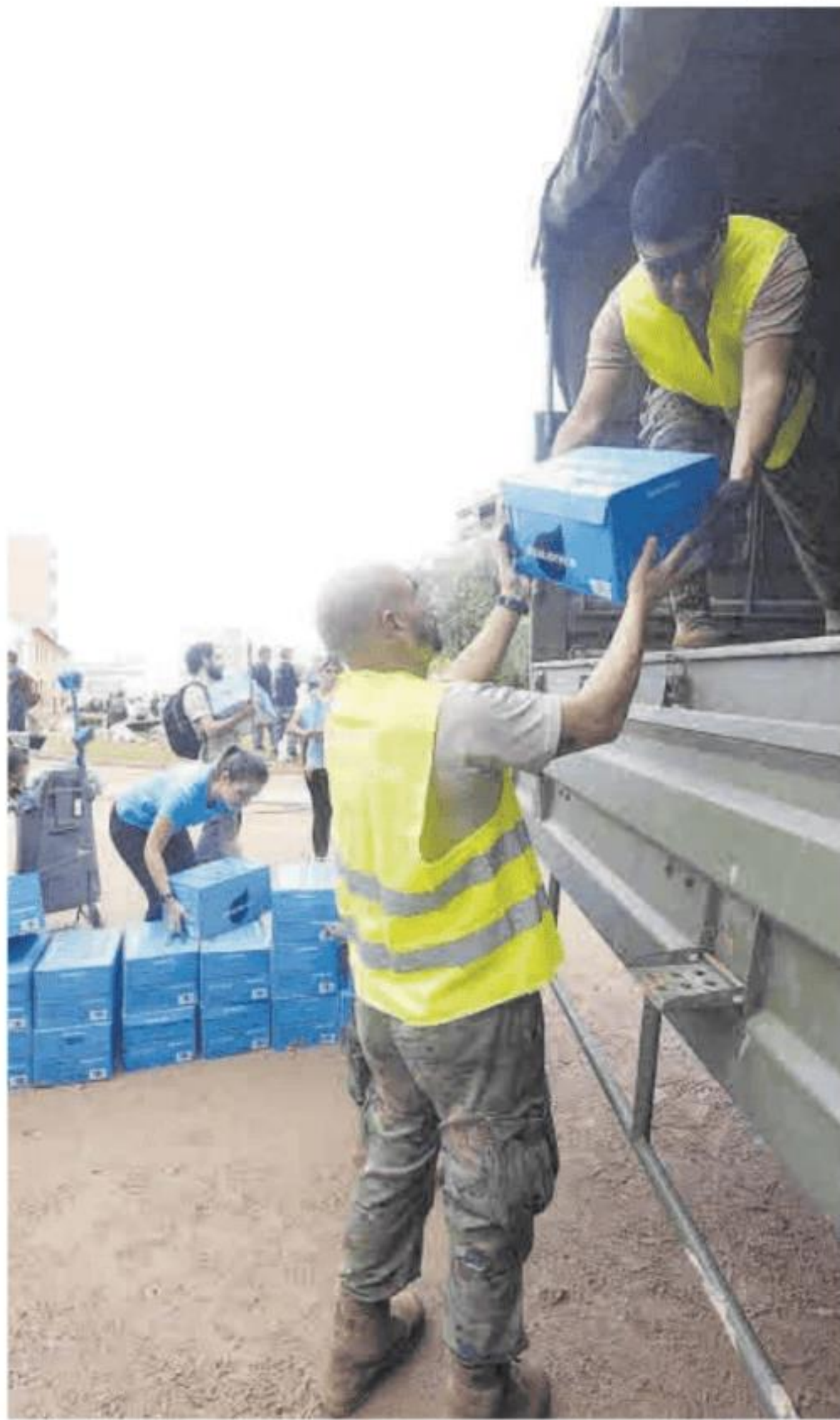
Militares del Ejército de Tierra reparten agua en Paiporta.

«El objetivo es garantizar el abastecimiento, retomar los suministros y monitorizar una recuperación paulatina de las infraestructuras», señaló por su parte Marlaska quien también aseguró el despliegue de Policía Nacional y Guardia Civil sin importar el ámbito de actuación competencial para poder evitar los episodios de «pillaje» y saqueo a comercios. Mazón (sobre