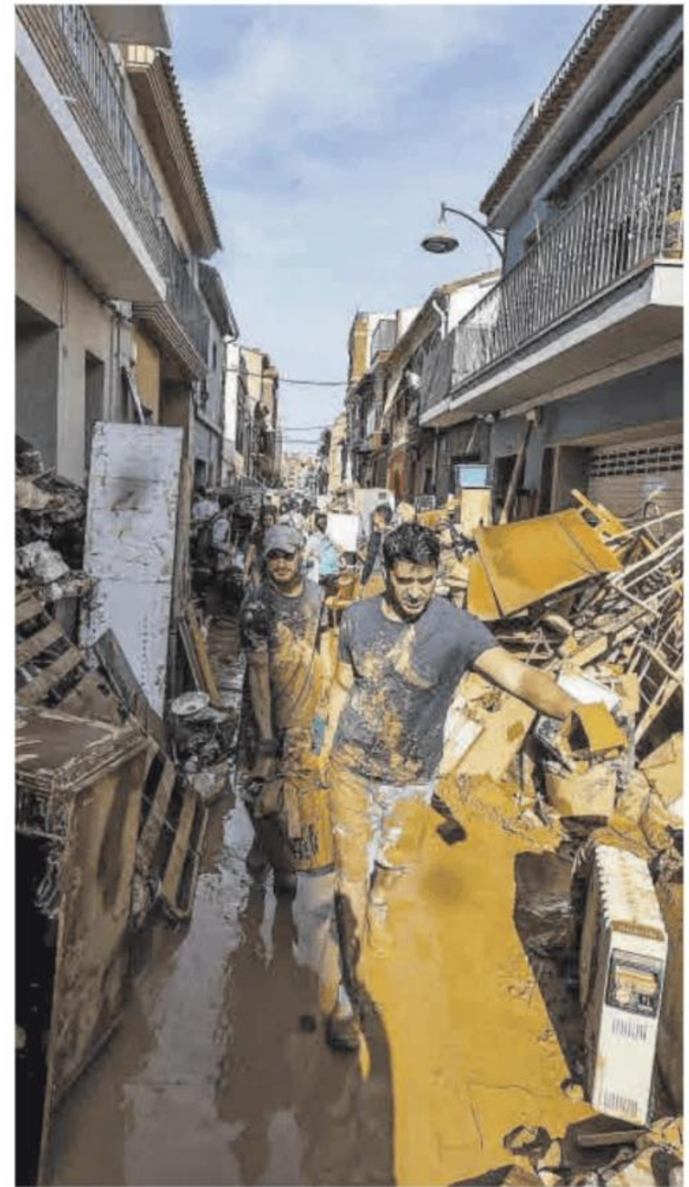
Vecinos colaborando en las labores de limpieza.

Ayer, con todo, la comunicación con los alcaldes comenzaba a canalizarse. La Diputación de Valencia ha tomado el mando de la