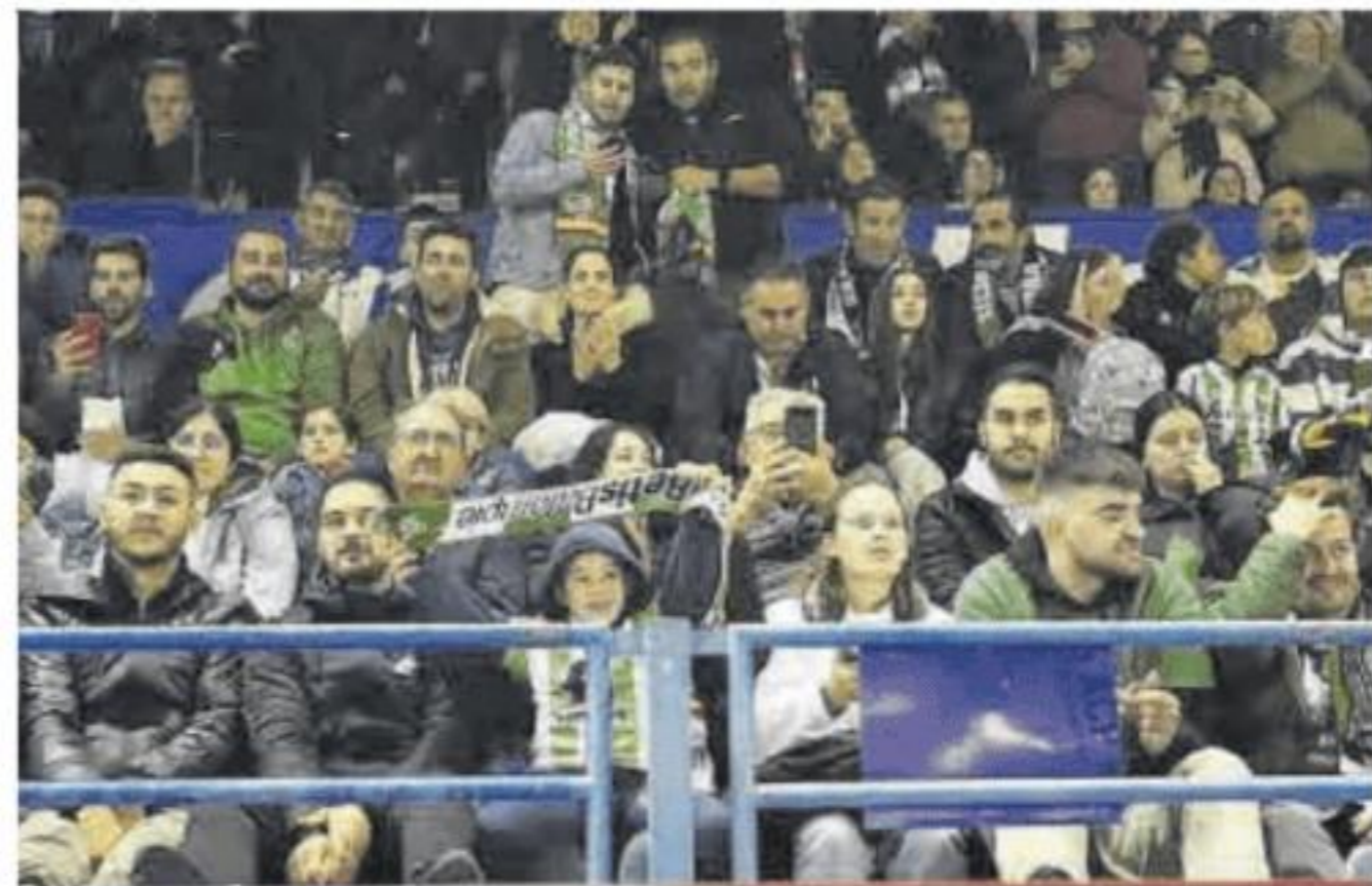
Aficionados en la grada del Francisco de la Hera de Almendralejo.