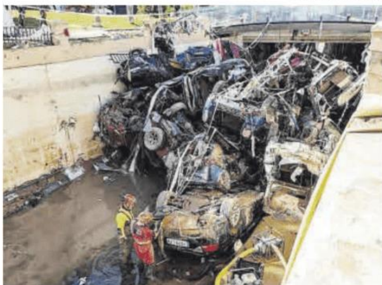
Vehículos acumulados en en la pista de Silla a la altura de Alfafar.

En la pista de Silla y sus inmediaciones el aire tiene un olor extraño. Un olor que no es solo a pantano, como repiten los camioneros que llevan tres días atrapados, sino a tragedia. El tramo de la pista contiguo a la zona comercial de Alfafar y Sedaví, en la provincia de Valencia, parece haber sufrido un bombardeo. Hay coches amontonados, camiones destrozados y objetos de todos los tamaños y formas descuajeringados, pero sobre todo se perciben restos de vida esparcidos por todas partes.