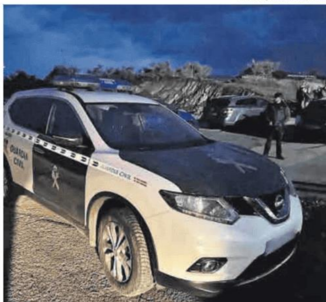
Redada de la Guardia Civil cuando capturaron al autor de los hechos.