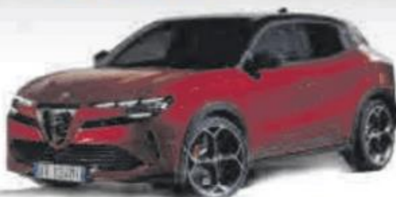
ALFA ROMEO JUNIOR