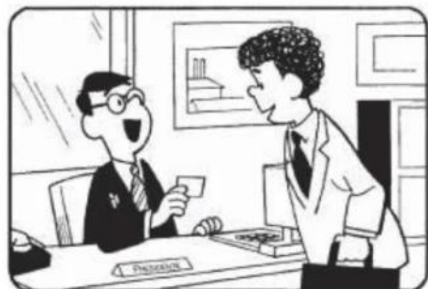
Diferencias 1. El teléfono está movido. 2. La tarjeta es más grande. 3. La corbata es distinta. 4. Falta la silla. 5. La mano está movida. 6. La ventana es más estrecha.