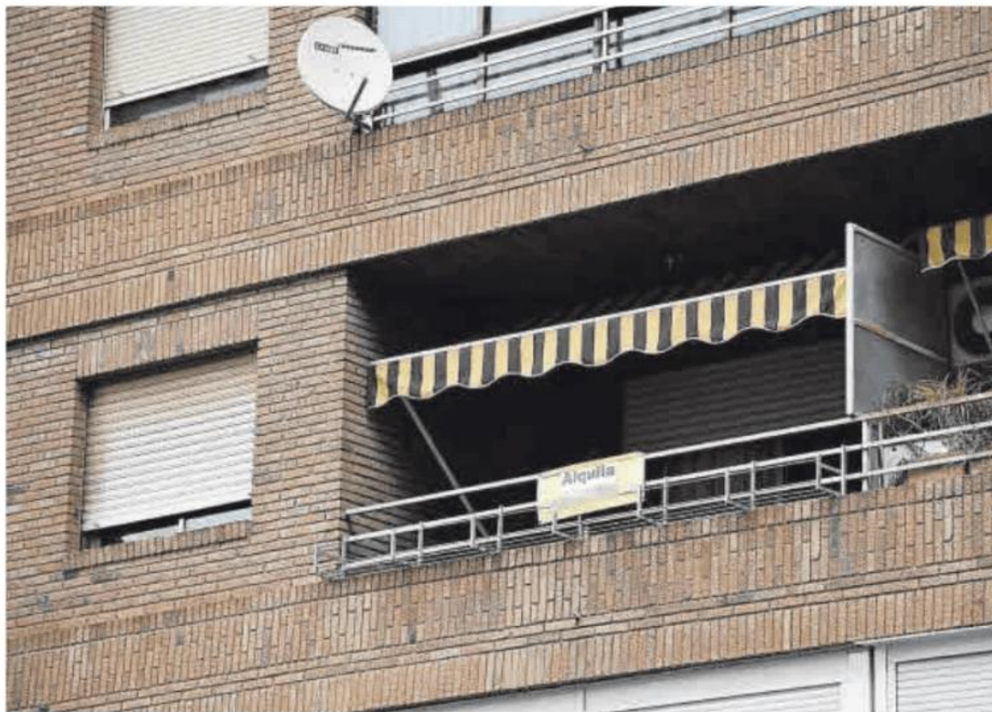
Los pisos en alquiler son cada vez más escasos en la ciudad.

pendiendo de los barrios. Las zonas más demandadas y más caras para alquilar en Badajoz son Valdepeñas, Las Vaguadas, Condes de Barcelona y la zona centro. En estos lugares los precios oscilan entre los siete y nueve euros por metro cua-