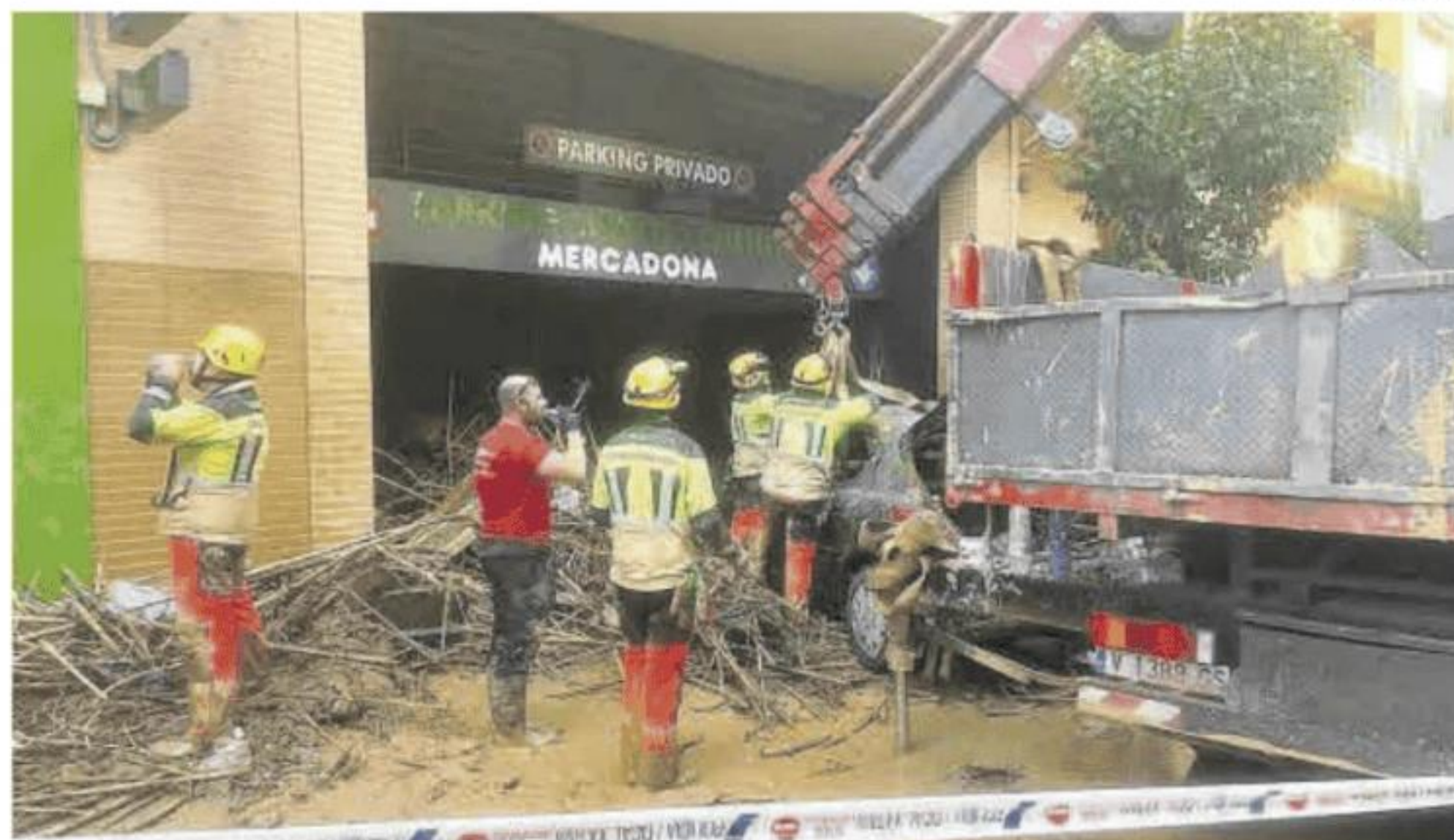
Bomberos de la Diputación de Badajoz trabajan en el acceso al parking de un supermercado en Catarroja.

«Hay miles de vehículos acumulados por todas partes. Los accesos al pueblo son muy complicados, solo hay un pequeño espacio en el medio para poder pasar», detalla.