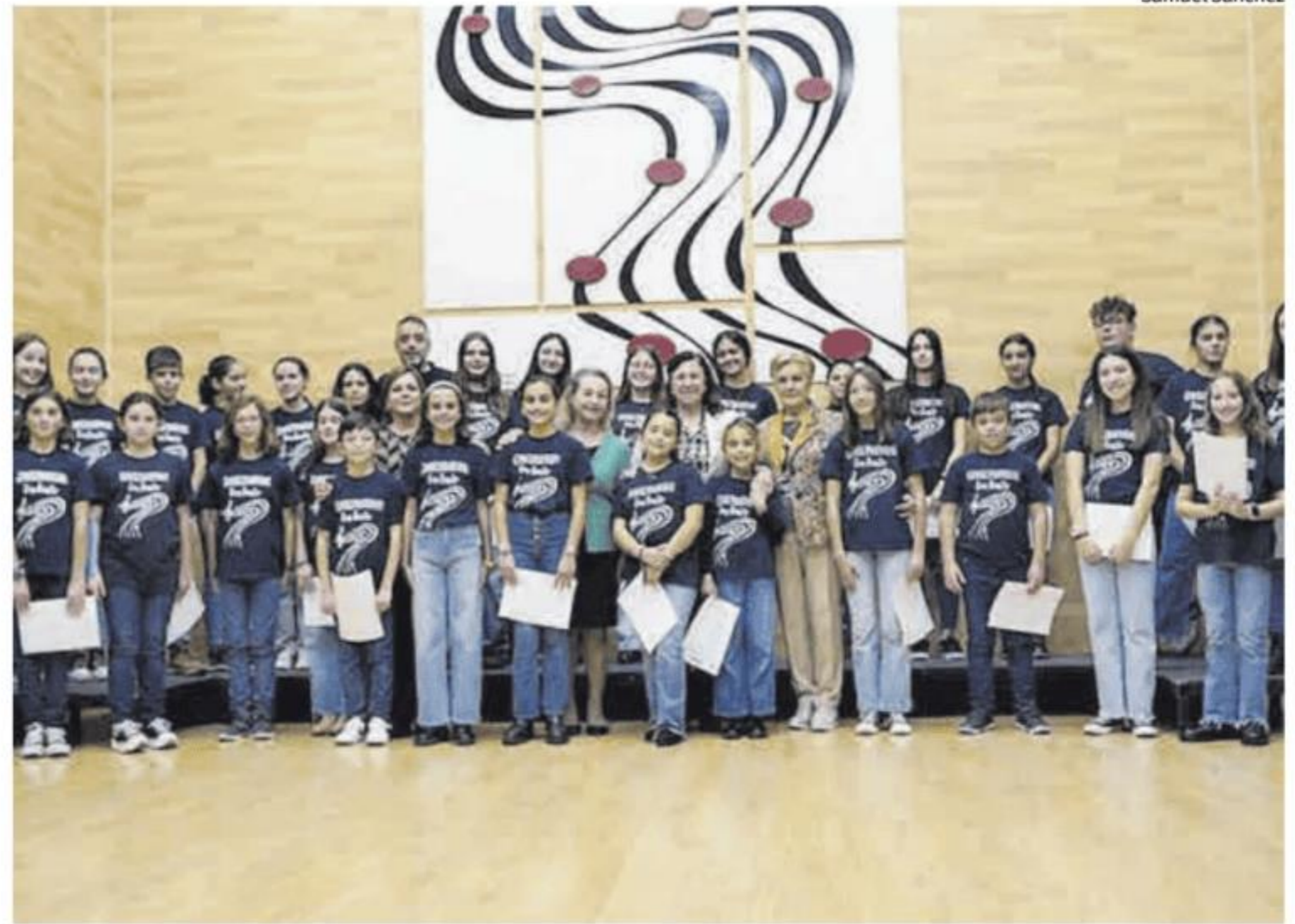
Alumnos del conservatorio, en el escenario.