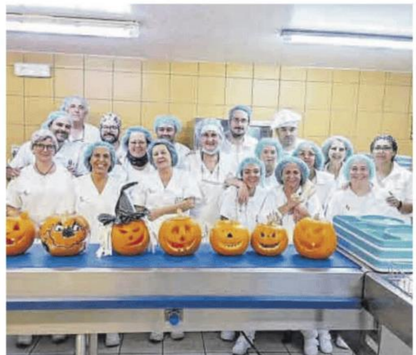
El personal de cocina posa con las calabazas.