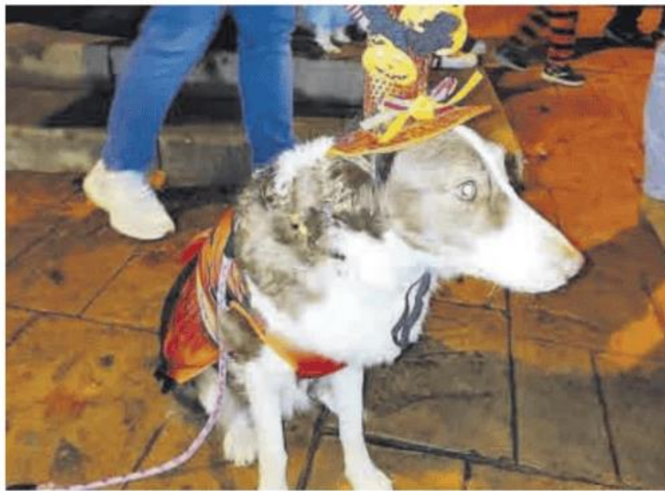
Un perro vestido para la ocasión.