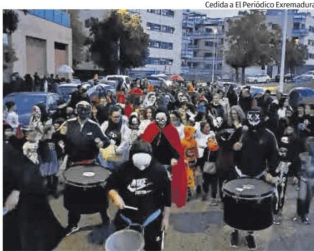
Disfraces y música para una tarde-noche de terror, este pasado jueves.