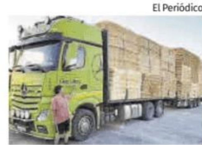
Eloy Durán, de Cáceres

Otro cacereño que se ha ofrecido a ayudar a las víctimas es Eloy Durán. Transportará el próximo martes y recogerá productos de una tienda de animales en Cáceres, que cargará en su camión el lunes por el tarde, y el resto lo re-