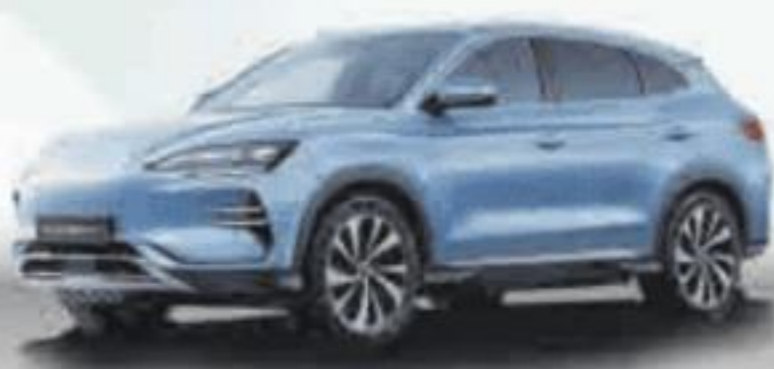
BYD SEAL U