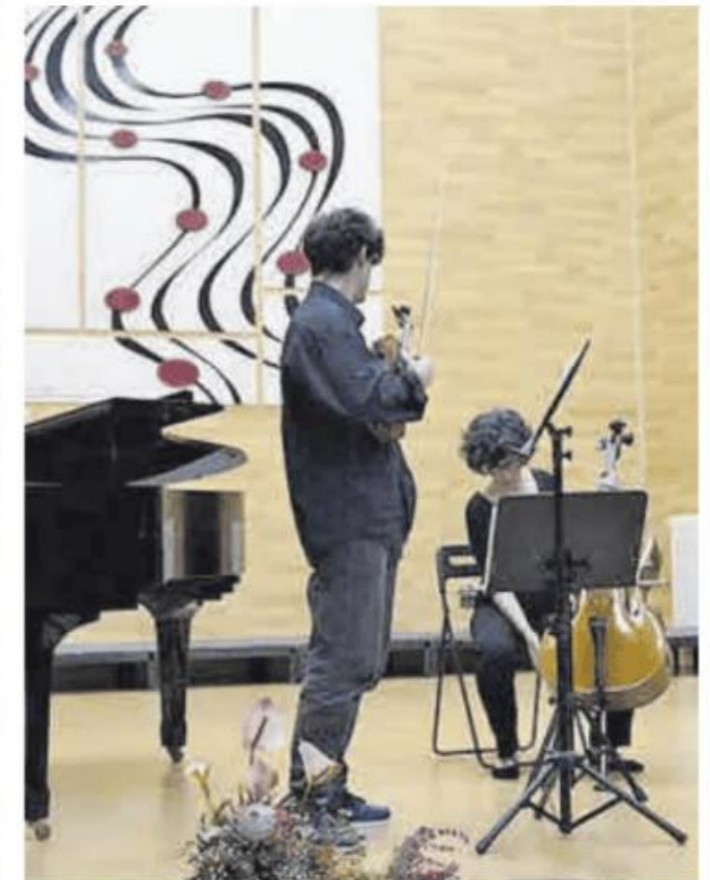
Actuación musical en el acto.