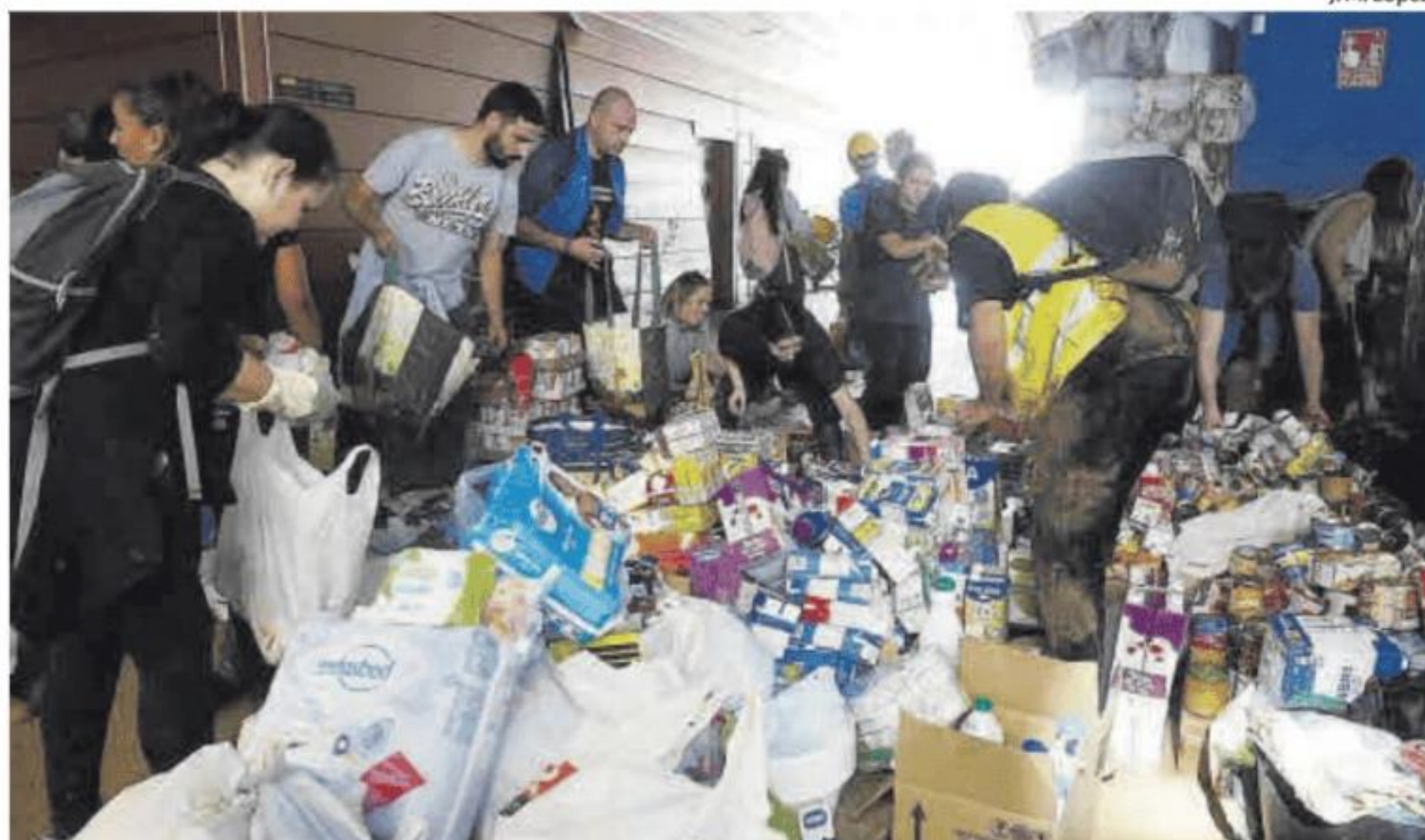
Voluntarios se organizan en un edificio municipal para repartir comida, calzado, medicamentos y ropa.

«¡Abran paso, abran paso!». Por la pista pasa un coche de Protección Civil. En mitad de la calle, hay una mujer hablando por el teléfono móvil. Parece relatarse a sí misma la historia de su supervivencia. «Estoy buscando mi coche. Me salvé de milagro», termina antes de explotar en un llanto descontrolado. ■