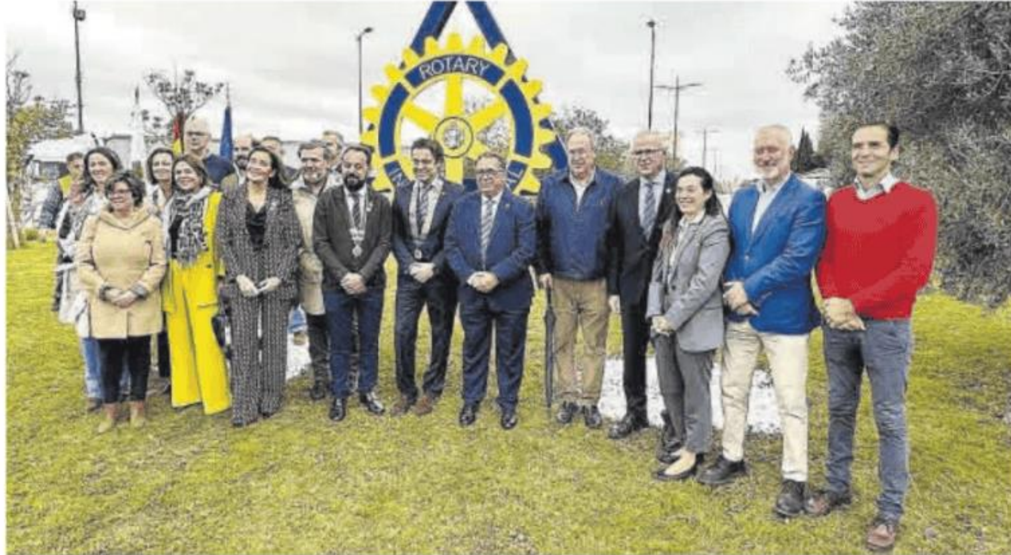
Inauguración de la rueda rotaria en la glorieta junto al cementerio.

El programa, según explica Rotary Almendralejo, «permite a los participantes vivir una inmersión cultural profunda», pasando un año escolar en el destino que elijan, alejados de su zona de confort y rodeado de nuevas experiencias y tradiciones. Uno de los requisitos fundamentales es tener un expediente académico notable y gran motivación para participar de la