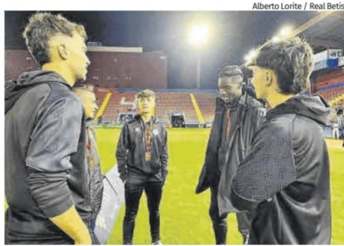
Jugadores de uno y otro equipo hablan antes del partido.