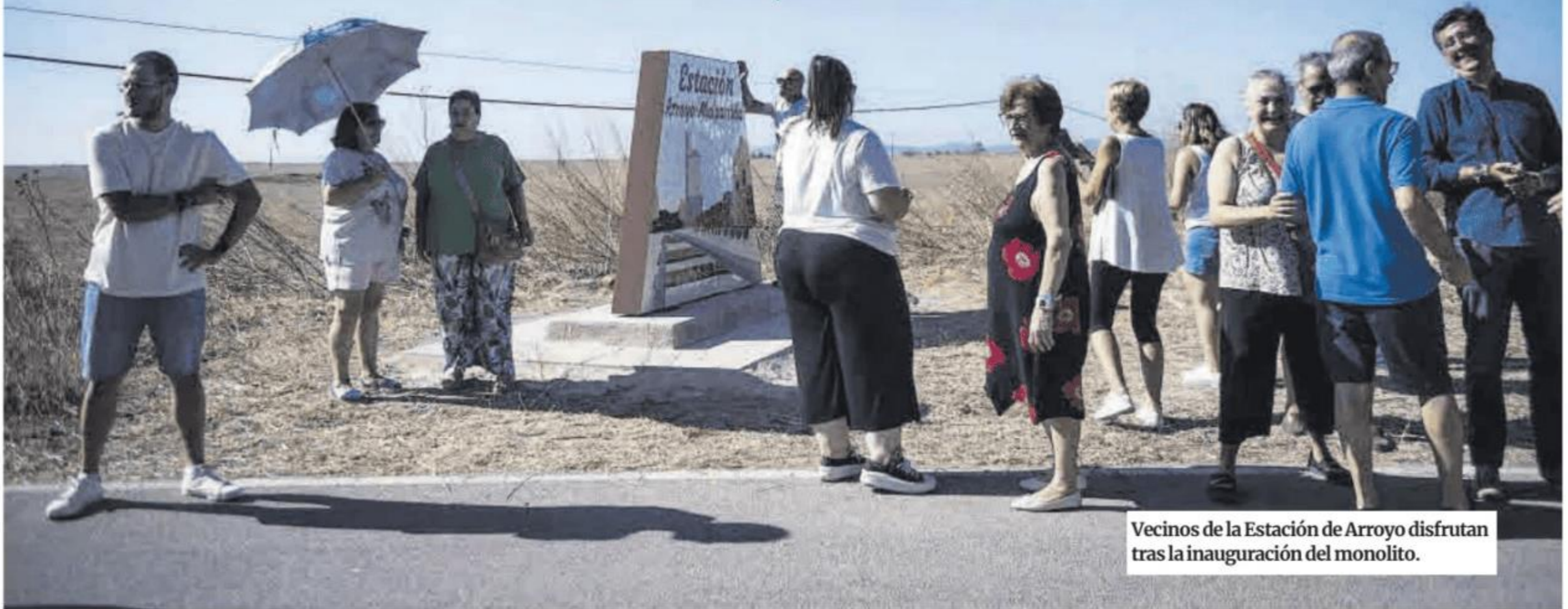
Vecinos de la Estación de Arroyo disfrutaron tras la inauguración del monolito.