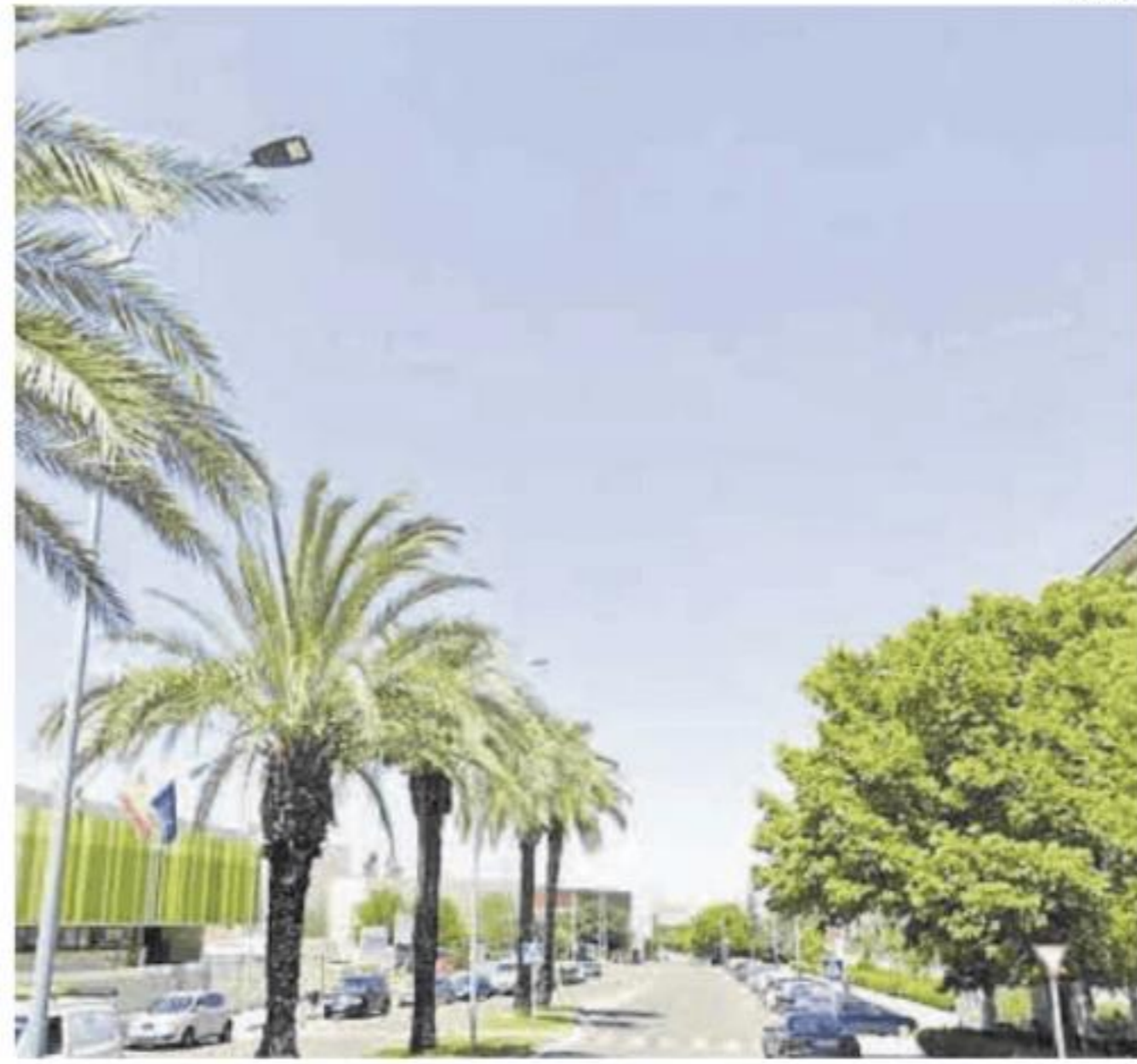
Avenida Antonio Cuéllar Gragera, lugar en el que se inició el suceso.

mientras realizaban labores de reparto, el detenido les conminó por la fuerza mientras les amenazaba con un hacha, a montarse en la furgoneta en que transportaban la paquetería que en esos momentos estaban entregando a domicilio. Así, les obligó a iniciar la marcha del vehículo y a trasladarle a la barriada de Valdepasillas, aprovechando dicho sujeto dada la indefensión de las víctimas, para abrir varios paquetes, guardándose varios de los objetos que portaban los mismos. Durante el trayecto, ya en Valdepasillas, el conductor de la furgoneta se dirigió a la Jefatura de Policía Local, ubicada en la Calle Godofredo Ortega y Muñoz con la esperanza de poder localizar a alguno de los agentes que con frecuencia entran y salen del edificio