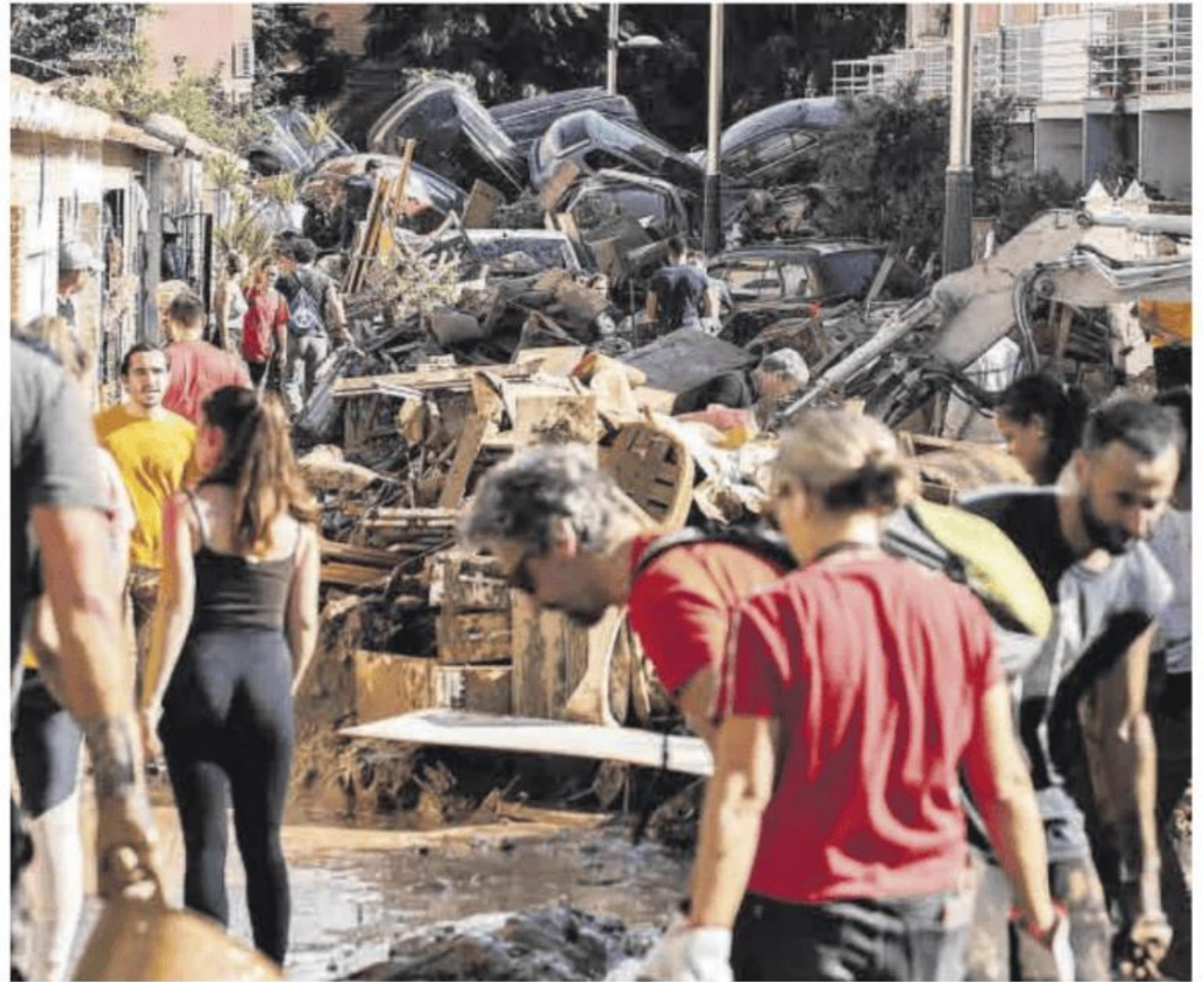
Coches amontonados en las calles de Benetússer.