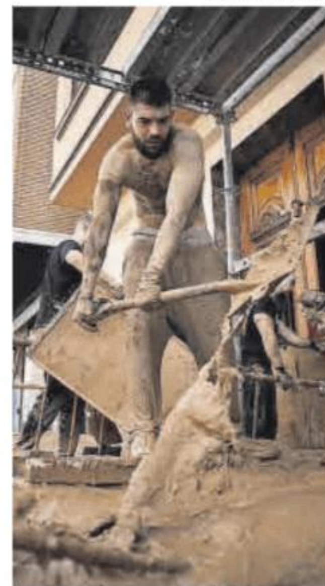
Barro en Massanassa.

El presidente de la Sociedad Española de Epidemiología recuerda que en ninguno de los anteriores episodios de inundaciones han sido un problema las infecciones. «En 1957 se produjeron enfermedades, pero fue porque la riada coincidió con un brote de gripe en Valencia», asegura. En este momento, advierte que las infecciones podrían aparecer «porque los alimentos hayan