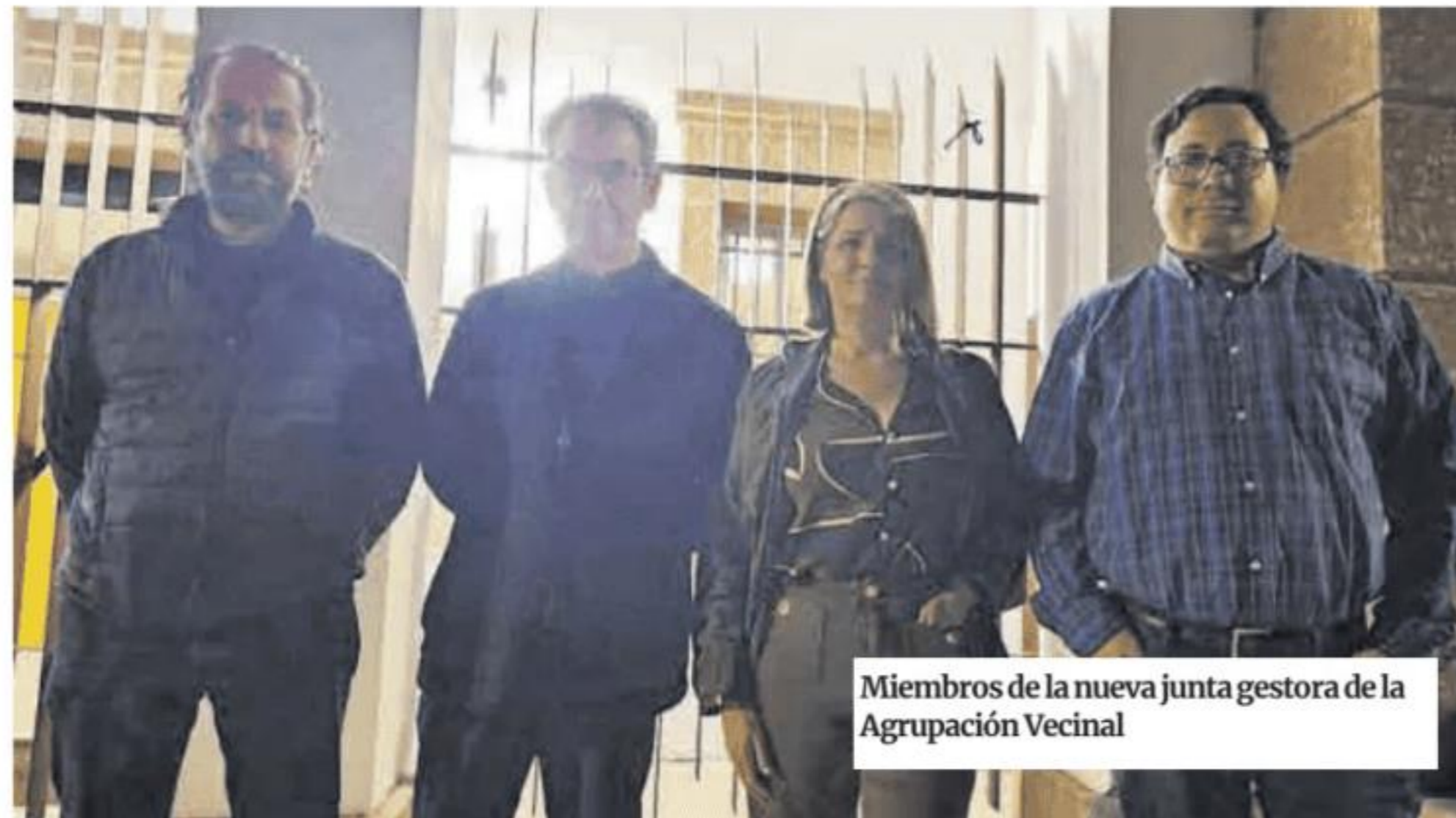
Miembros de la nueva junta gestora de la Agrupación Vecinal